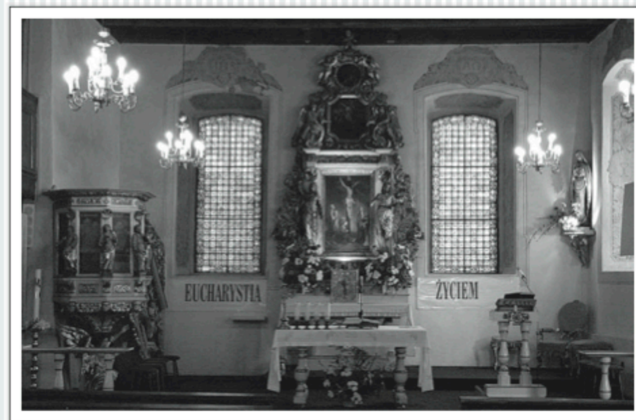
Wnętrze kościoła, 2005

W ährend der Belagerung Stettins durch die Brandenburgischen Soldaten im Jahr 1677