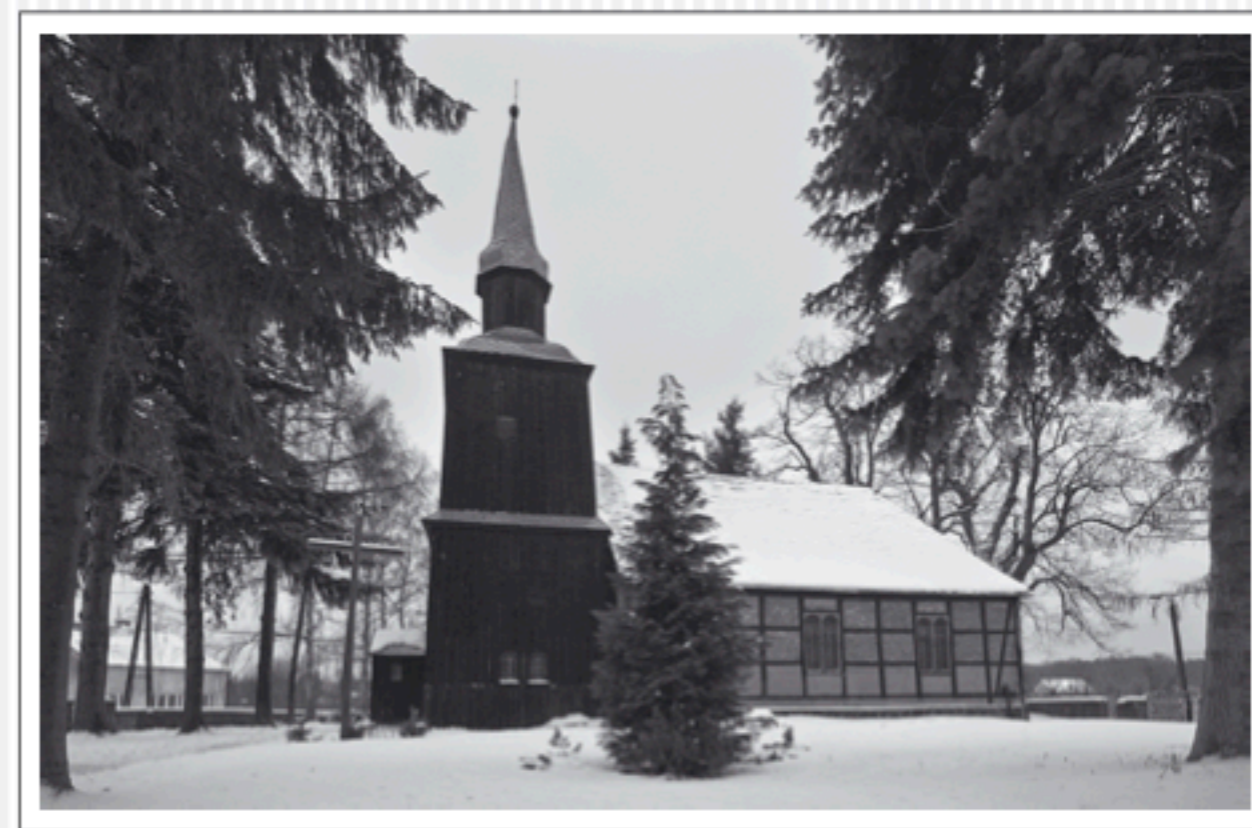
Widok na kościół w Płoni, 2009

D ie Ausstattung der Kirche aus der Vorkriegszeit bildet die Orgelempore mit der Füllungbalustrade vom Anfang des XX. Jahrhunderts sowie die Gussglocke vom