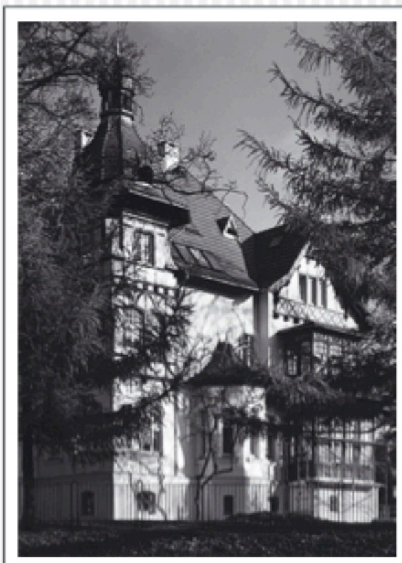
Willa przy ul. Solskiego 3, 2002 Die Villa am Eichendorffweg 3, 2002