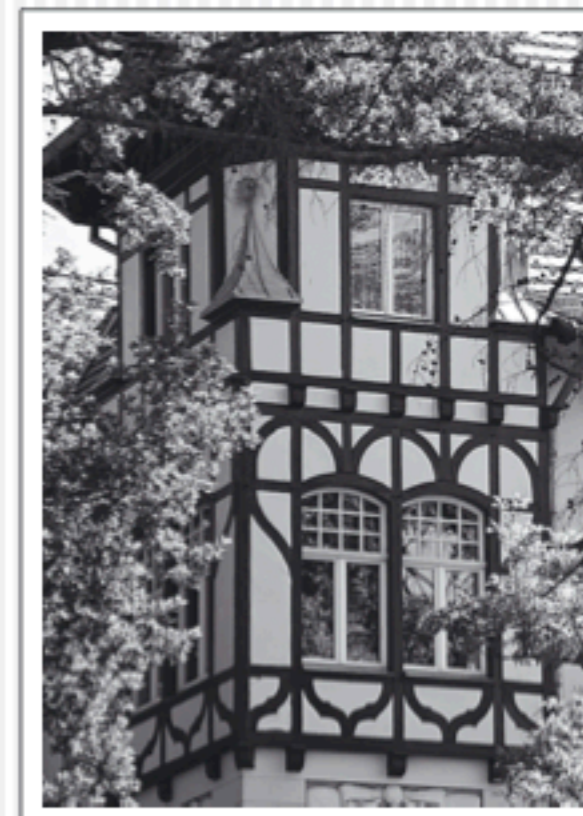
Willa przy ul. Solskiego 3, 2009 Die Villa am Eichendorffweg 3, 2009