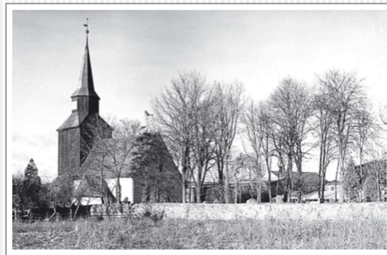
Kościół w Krzekowie, 1930