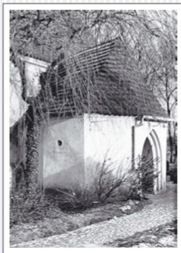
Zakrystia kościoła w Krzekowie, 1930 Die Sakristei in der Kirche in Kreckow, 1930

Kreckow erlitt während des II. Weltkriegs keine Verluste und wurde am 20. September 1945 von der polnischen Verwaltung übernommen. Die Einwohner des Bezirks waren hauptsächlich in der Landwirtschaft angestellt. In den 60er Jahren des XX. Jahrhunderts erfolgte eine rapide Entwicklung der Gärtnerei, für die zahlreiche Glashäuser an der Kreckower Dorfaue errichtet wurden. 1970 zählte der Bezirk 650 Einwohner. In den 90er Jahren befand sich in Kreckow die Filiale der Landes- und Stadtbibliothek, die Fabrik von Mineralwasser mit Kohlensäure an der Modra Straße, die Mühle an der Kreckower Dorfaue sowie das Heim für minderjährige Jungen in der Modra Straße 11.