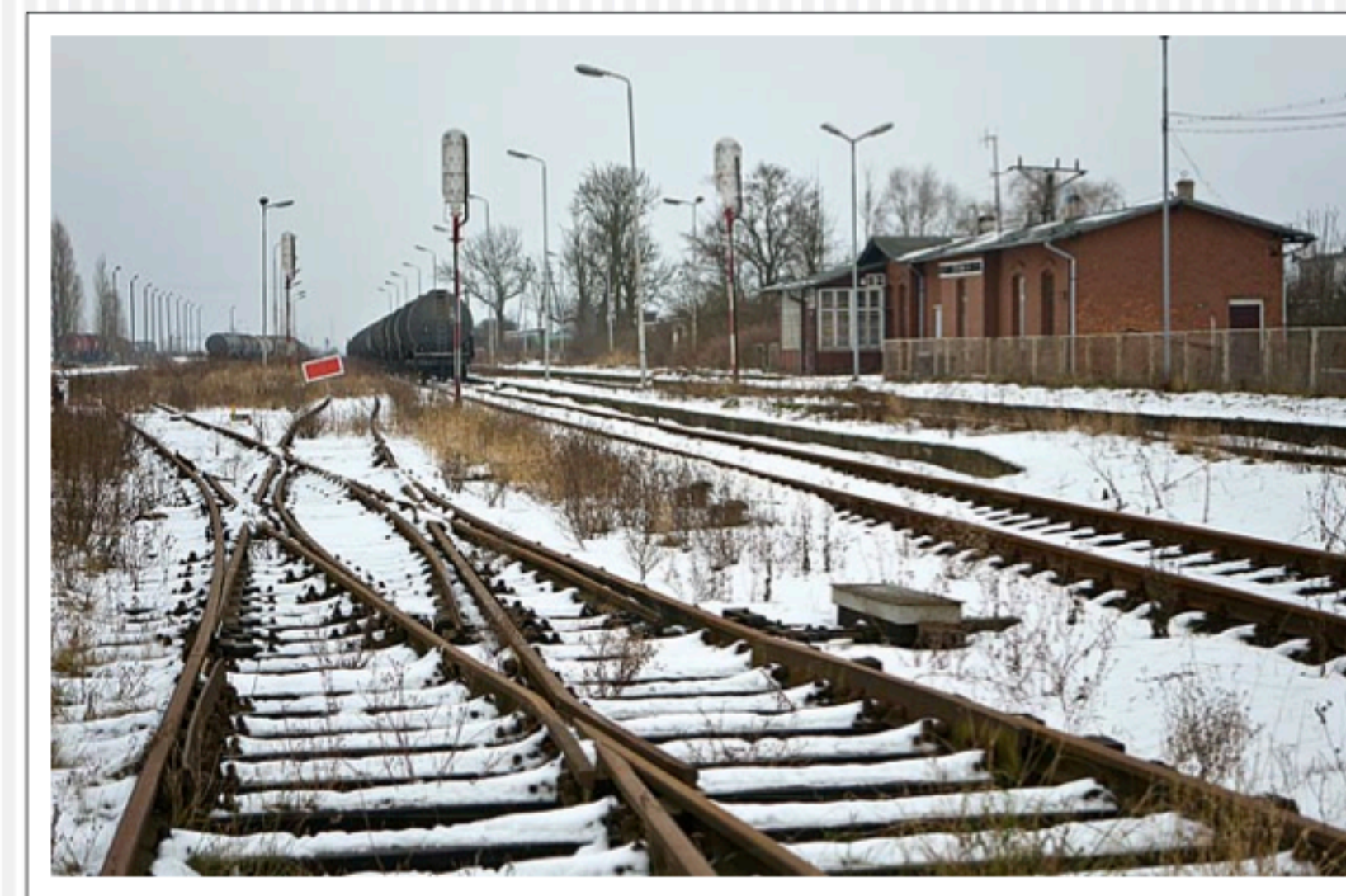
Dworzec w Stobnie, 2009