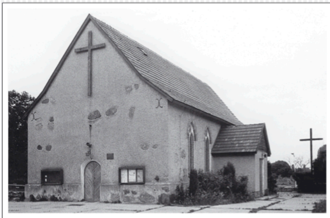
Stary kościół w Kłęskowie, 1989

Wegen der Tatsache, dass die alte Kirche zu klein für die große Anzahl der Gläubigen war, entschloss sich der Priester Andrzej Pastuszek im Jahr 1995, der Kirche ein verbreitetes Schiff von der westlichen Seite nach dem Projekt des Architekten Maciej Płotkowiak anzubauen. 1996 wurden die Fundamente für das neue Bauwerk (33 x 19 m) gelegt. Drei Jahre später wurden die Wände gebaut, in den Jahren 2000 bis 2001 das Dach fertiggestellt und die Fenster eingesetzt. Die Wände sind 7 m hoch und die westliche Giebelwand ist 23 Meter hoch. Am 20. August 1998 wurde der Priester Józef Filipek zum neuen Pfarrer ernannt. Zum Fronleichnamfest im Jahr 2001 wurde in der neuen Kirche der erste