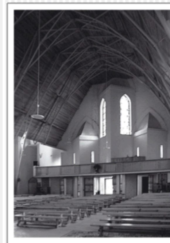
Wnętrze nowego kościoła, 2005 Der Innenraum der neuen Kirche, 2005