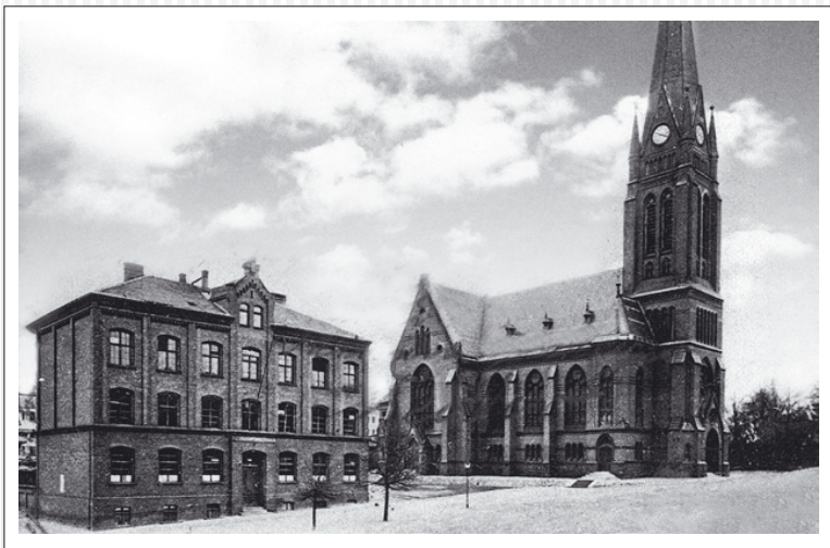
Szkola i kościół przy pl. Matki Teresy z Kalkuty, 1905

W 1853 roku związek parafialny założył szkołę dla małych dzieci, w roku 1862 uczęszczało tam 23 dzieci. W tym samym roku ukończono budowę szkoły na nowym cmentarzu przy ul. Malczewskiego. Od 1860 roku do szkół wprowadzono lekcje gimnastyki, w tym celu założono boisko sportowe obok starego cmentarza przy ul. Firlika. Szkoła w Grabowie znajdowała się przy ul. Łyskowskiego 17 na działce nr 99. W 1865 roku znajdowały się tam dwa budynki szkolne, oraz studnia z pompą na dziedzińcu szkolnym. W 1861 roku wykonano przybudówkę do drugiego budynku szkolnego o długości 36 stóp.